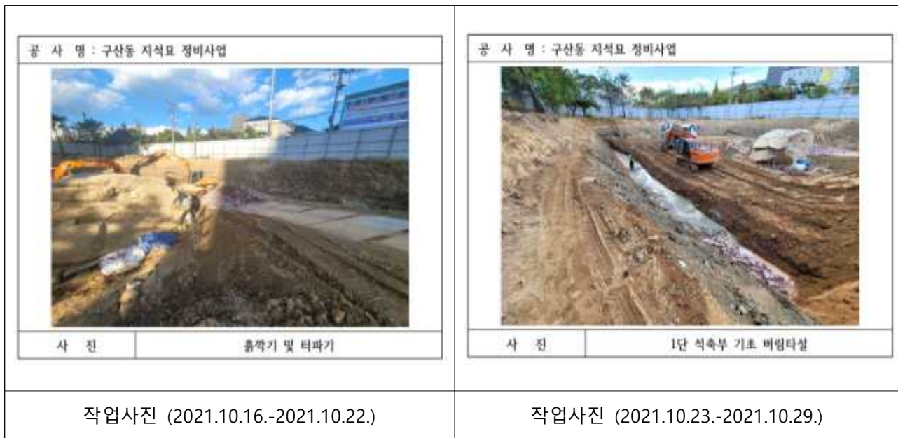
[그림 1] 현상변경 무허가 기간의 작업사진

이와 관련하여 감사기간 중 확인한 결과, 당초 현상변경 허가기간이 만료된 2021. 7. 1.부터 재허가가 통보된 2021. 11. 17. 사이에 [그림 1]과 같이 지식묘 묘역 내에서 흙깎기, 기초터파기, 석축부 잡석다짐 등 김해시에서 무단으로 현상변경 행위를 한 사실이 [그림 2]의 시공사 작업일지를 통해서 확인되었다.