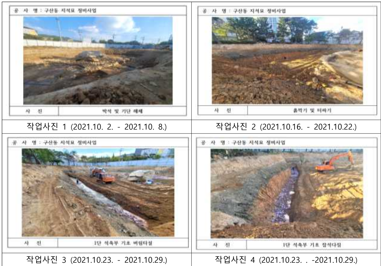
[그림 2] 작업사진(시공사 작업일지)