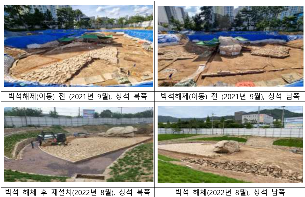
[그림 3] 박석해체(이동) 전후 사진