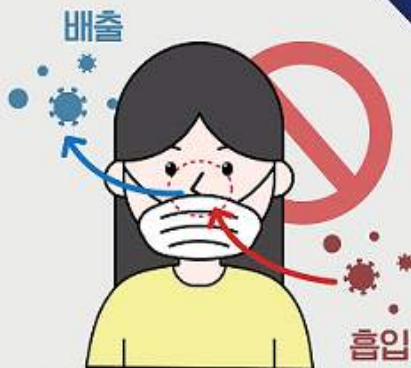
① 코가 노출되는 마스크 착용