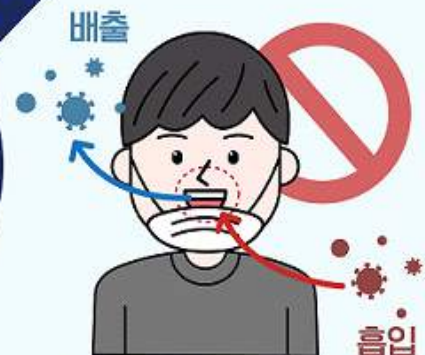
② 턱에 걸치는 마스크 착용