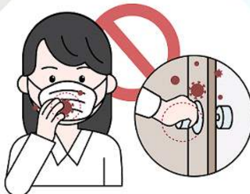
③ 마스크 겉면을 만지는 행위