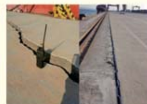
• 영일만 부두 지반 균열