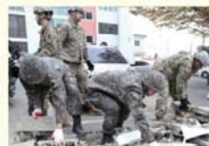
• 포항시 흥해읍 응급복구