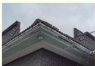
• 주택 지붕 난간 파손