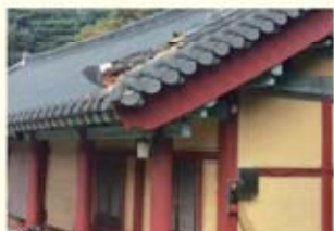
• 불국사 지붕 기와 파손