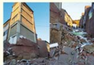
• 환어동 대동빌라 외벽 탈락