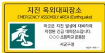
〈지진 옥외대피장소 표지판〉

지방자치단체에서는 지진 및 지진해일 발생 시 주민들이 일시적으로 안전하게 대피할 수 있도록 "지진 옥외대피장소", "지진해일 긴급대피장소"를 지정 및 관리하고 있습니다. 대피장소 정보는 국민재난안전포털( www.safekorea.go.kr ), 공공데이터포털( www.data.go.kr ) 및 '안전디딤돌 앱'에서 확인할 수 있습니다.