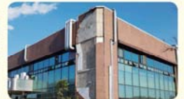
건물 외벽 탈락