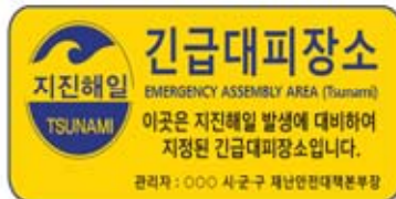
〈지진해일 긴급대피장소 표지판〉