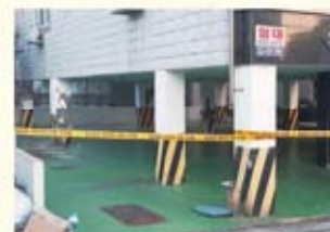
• 장량동 오서빌 필로티 붕괴