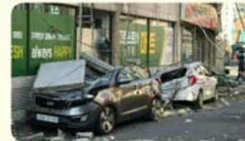
낙하물 차량 파손