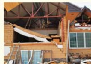
• 장량동 주택 외벽 파손