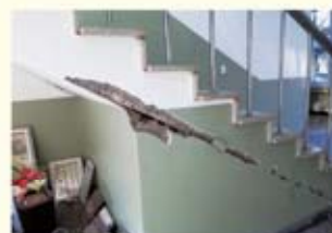
• 포항흥해광고 계단 균열