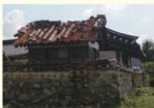
• 사마소 지붕 기와 파손