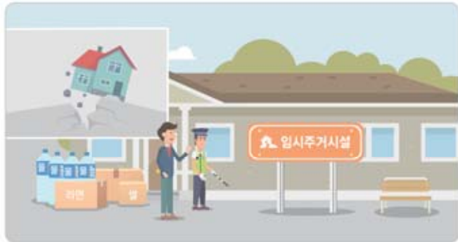
배정된 공간 사용

지진으로 주거시설을 상실하거나 사실상 주거가 불가능한 경우, 구호기관(지자체)의 안내를 받아 임시주거시설에서 생활 할 수 있습니다. 갑작스러운 재난으로 임시주거시설에서 지내야 할 경우에는 공동생활의 필요한 규칙을 지키도록 합니다.