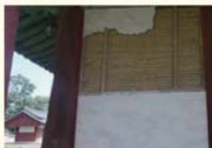
• 경주 황교 벽체 파손