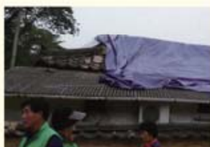
• 경주시 월성동 응급복구