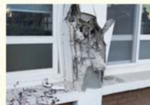
• 흥해초등학교 건물 기둥 파손