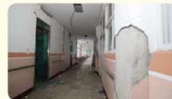
건물 내부 벽체 파손