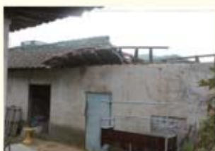
• 창고 지붕 파손