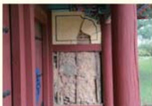
• 신문왕릉 벽체 파손