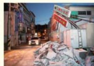
• 흥해읍 상가 외벽 붕괴