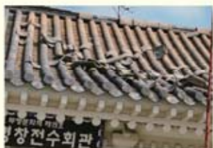
• 무형문화재 전수관 지붕 기와 파손