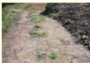
• 사곡지 저수지 둑 균열