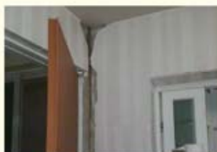
• 주택 균열