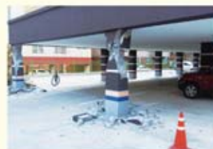
• 장량동 크리스탈 필로티 붕괴