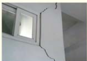
• 주택 균열