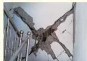
• 장량동 기계공 주택 내벽 파손