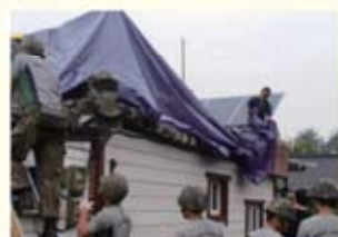
• 경주시 보덕동 응급복구