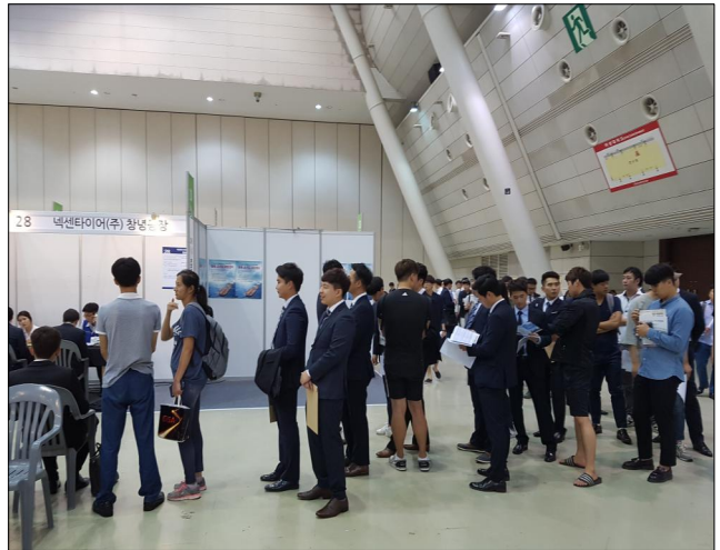
【넥센타이어 면접 대기행렬】