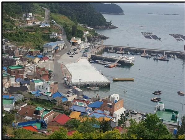
연명항 어항시설공사 전경사진