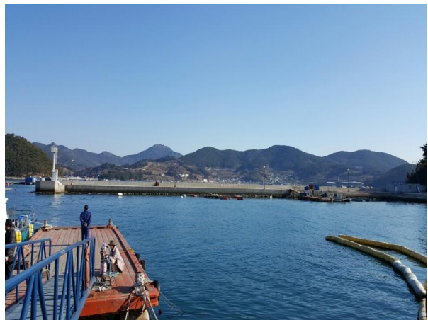
곤리항 어항시설공사 전경사진