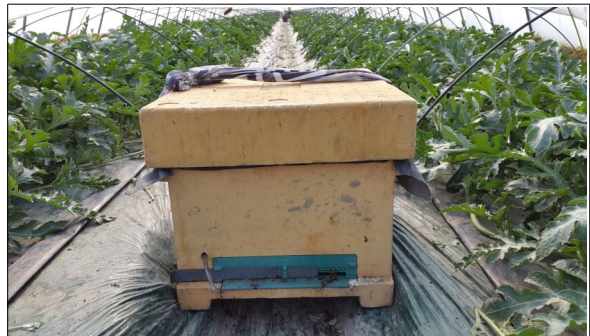
수박재배 비닐하우스 내 수정별(양봉)상자

(친환경농업과 채소특작담당 담당자 성명 곽정숙 ☎055-211-6354)