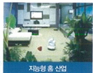
지능형 홈 산업