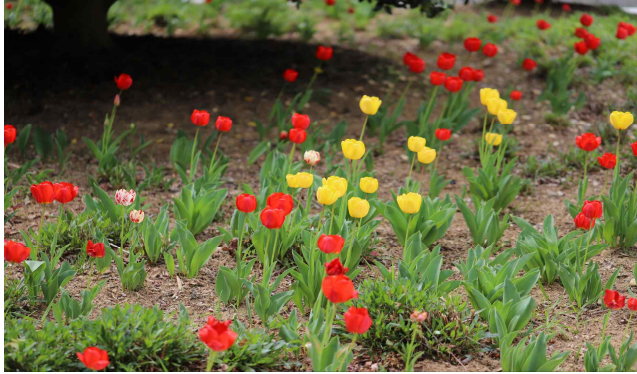
튤립 Tulipa gesneriana