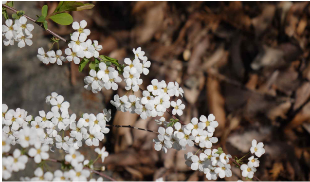
조팝나무 Spiraea prunifolia

4~6월에 담홍색의 심장모양으로 꽃이 총상꽃차례로 줄기 끝에 주렁주렁 달립니다. 한방에서 전초를 채취하여 말린 것을 금낭(錦囊)이라 하며, 꽃말은 「당신을 따르겠습니다.」입니다.