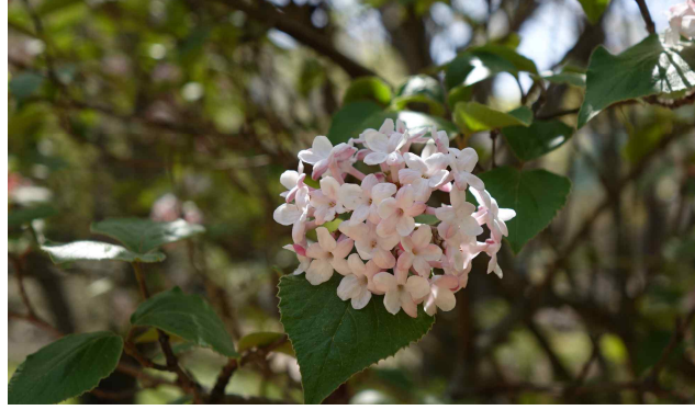
분꽃나무 Viburnum carlesii

꽃이 만발한 식물체의 모양이 튀긴 좁쌀을 붙인 것 같이 보인다고 하여 조팝나무라 합니다. 흔히 생울타리로 심으며, 어린 순은 나물로 먹고 뿌리는 한방에서 약재로 이용합니다.