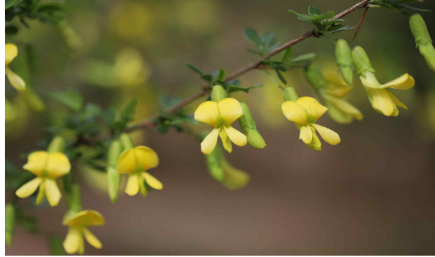
골담초 Caragana sinica

네덜란드의 국화 튤립의 원산지는 사실 터키입니다. 16세기 후반에는 귀족의 상징으로 자리매김하여 가격이 매우 높았다고 합니다.