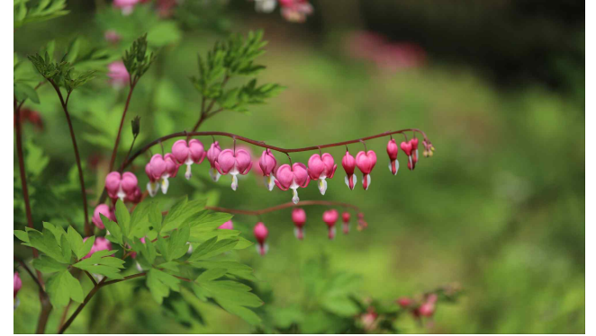
금낭화 Dicentra spectabilis

뿌리, 꽃 등을 약재로 활용하며, 뼈에 좋다고 하여 골담초라 이름이 지어졌습니다. 꽃은 5월에 짧은 가지의 잎겨드랑이에 노란색의 나비모양으로 1~2개씩 피며, 우리나라 전국에 분포합니다.