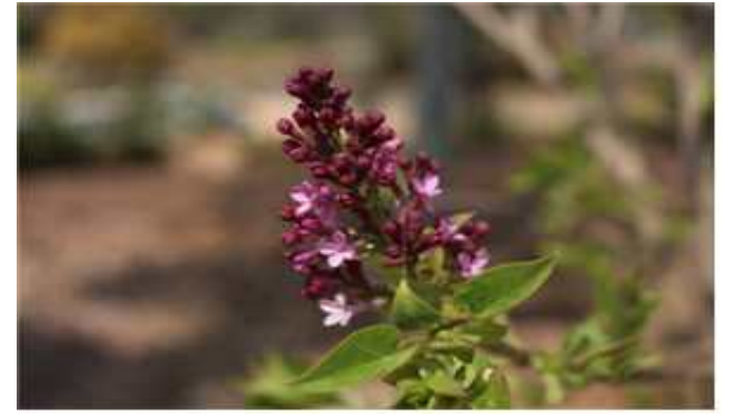
수수꽃다리 Syringa oblata var. dilatata

분꽃나무는 향긋한 분내가 나는 꽃나무라는 뜻에서 유래된 이름입니다. 꽃은 4~6월에 암수한그루로 피며, 우리나라 전역에 자생합니다.