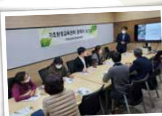
기초환경교육센터 관계자 워크숍