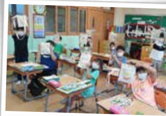
찾아가는 환경교육 - 생태교실