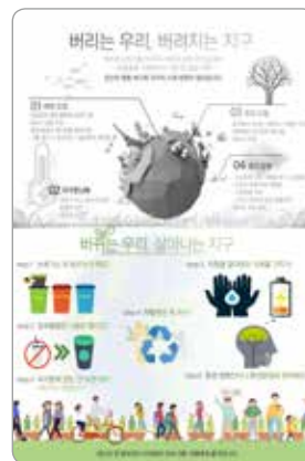
이재곤 동원고등학교 1학년