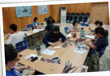
업사이클러 전문가 과정