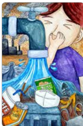
김민지 제산초등학교 4학년