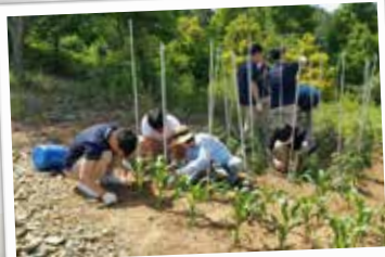
찾아가는 환경교육 - 학교텃밭