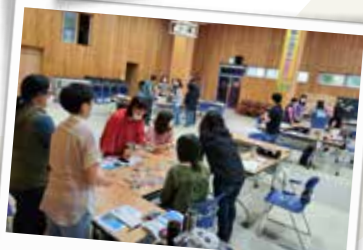
퍼실리테이션 전문화 교육