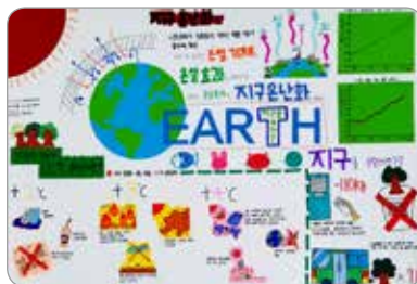
곽민진 분성중학교 3학년