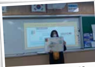
찾아가는 환경교육 - 미세먼지 교육