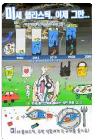
김연희 능포초등학교 6학년