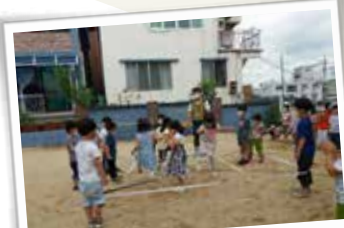
찾아가는 환경교육 - 환경 유치원