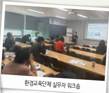
환경교육단체 실무자 워크숍