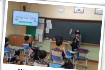
찾아가는 환경교육 - 자유학년제