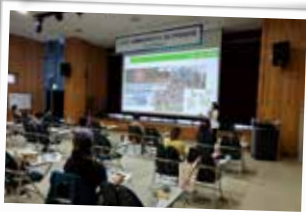
사회환경교육지도사 3급 간이양성과정