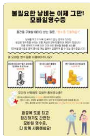
김서연 동원고등학교 1학년