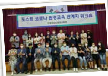
포스트 코로나 환경교육 관계자 워크숍