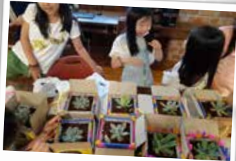
찾아가는 환경교육 - 생활환경학교