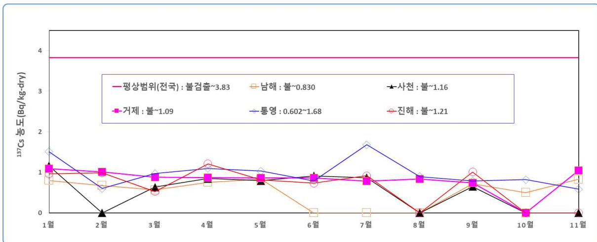
Figure 2. 갯벌의 ^{137}\text{Cs} 분포경향