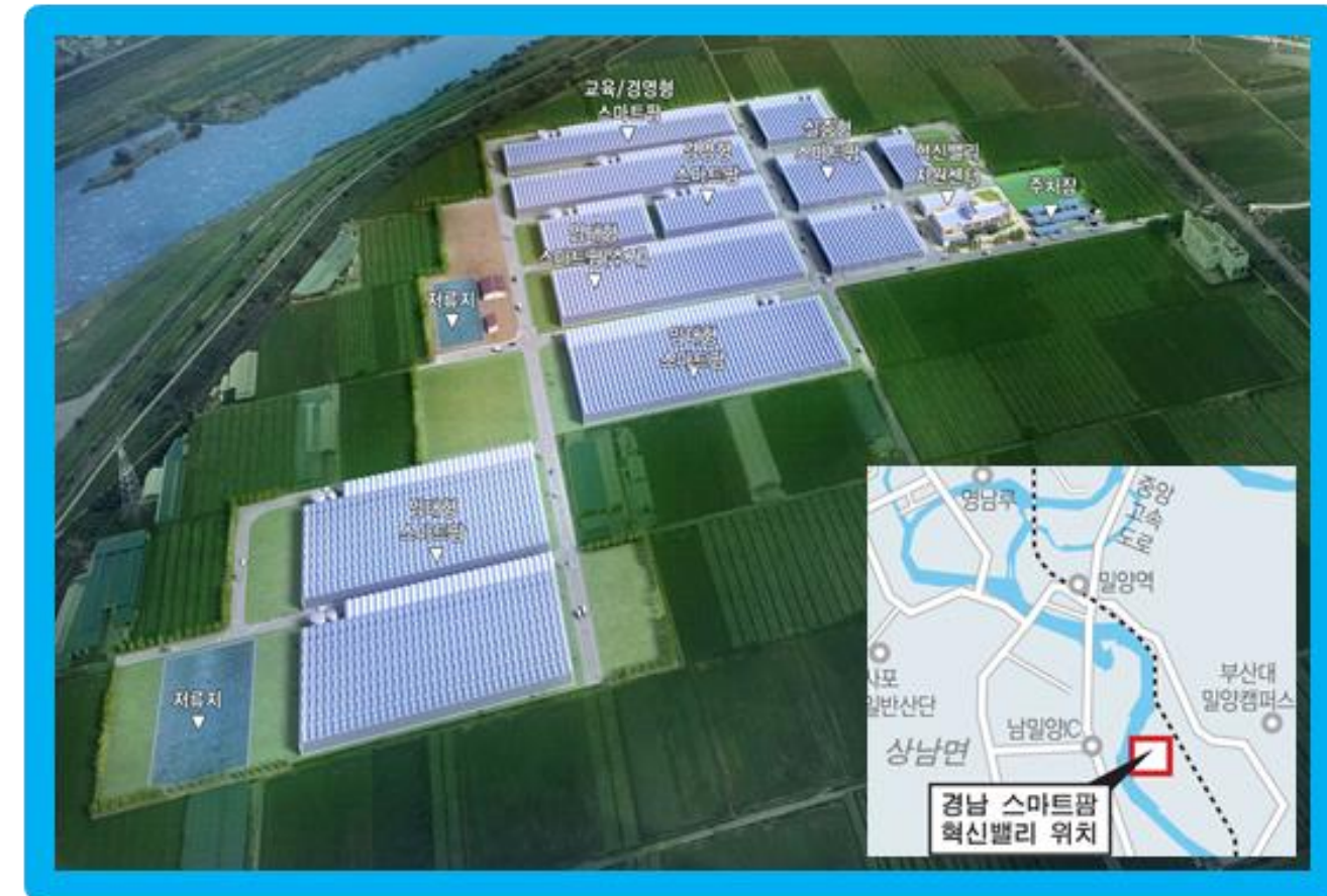
경상남도 밀양 (2차지역)