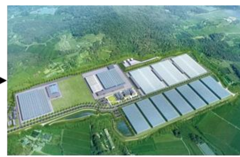
경상북도 상주 (1차지역)