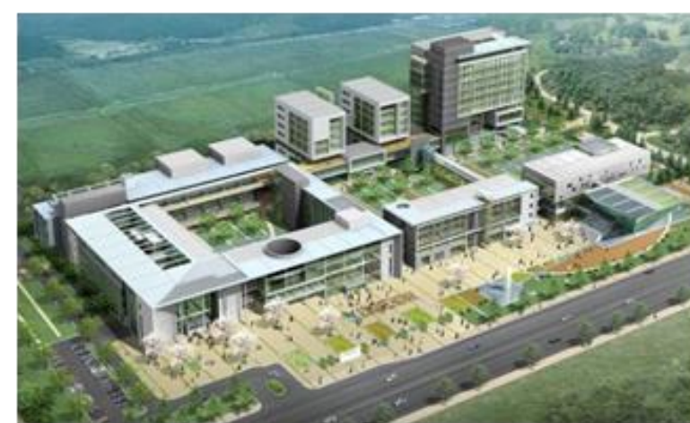
전라남도 고흥 (2차지역)