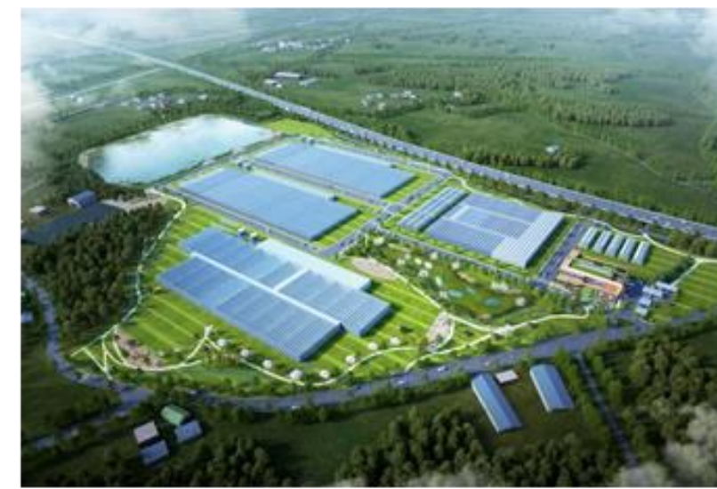
전라북도 김제 (1차지역)