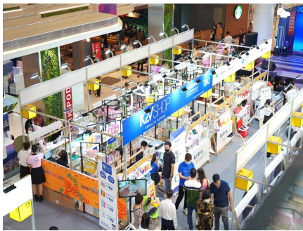
에스텔라 행사장 전경