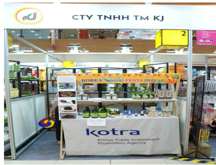
에스텔라 행사장 부스