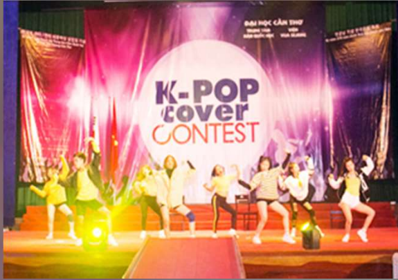
K-POP 커버 댄스 경연대회