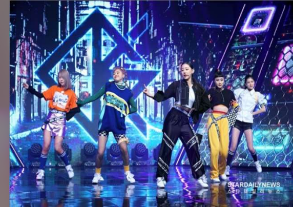
K- POP 공연