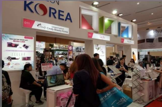
K- Cosmetic, Healthcare 전시