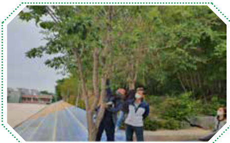
수목진단(대나무, 이팝나무) 중