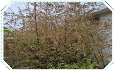
대나무류 응애 및 녹병 피해, 오죽 개화 현상