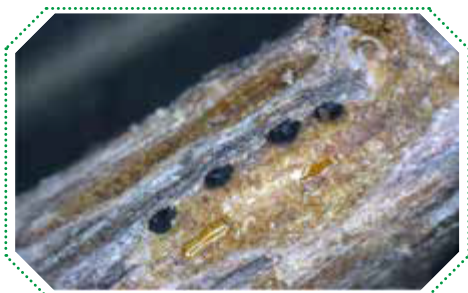
소나무(솜벌레) 및 반송(피목가지마름병) 산림병해충 모습