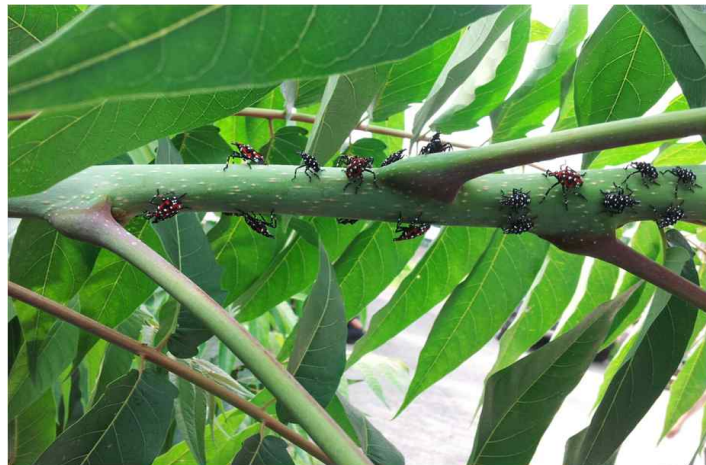
집단 가해중인 유충

연 1회 발생하고 알로 월동한다. 춘기에 부화한 약충은 날개는 없으나 뒷다리가 발달하여 점프로 이동하며, 7월 하순경 우화한 성충은 날개가 발달하고 1개월 이상 생육하며 나무 줄기, 건물 벽면 등에 산란한다.